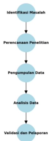
Diagram Alir Metode Penelitian

Penelitian ini menggunakan pendekatan mixed-methods , yaitu kombinasi antara metode kualitatif dan kuantitatif untuk mengumpulkan dan menganalisis data. Metode ini memungkinkan pemahaman yang mendalam tentang strategi branding di pasar makanan Indonesia melalui berbagai perspektif. Data kualitatif diperoleh melalui wawancara mendalam, sementara data kuantitatif dikumpulkan melalui survei terstruktur. Kombinasi ini memberikan wawasan yang lebih komprehensif mengenai hubungan antara strategi branding dan nilai pasar.