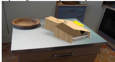
Gambar 4. Sapu Mini Elektrik

Gambar di atas merupakan gambar dari produk sapu mini terdahulu atau produk pesaing. Produk sapu mini terdahulu masih sangat konvensional dan mengandalkan tenaga manusia. Di lihat dari segi ukurannya sangat kecil maka dari itu memiliki kapasitas sedikit untuk menampung sampah. Sedangkan, produk inovasi sudah memiliki fitur elektrik, dari segi ukuran juga tidak terlalu kecil dan memiliki penutup untuk menampung sampah. Berikut merupakan gambar dari produk sapu mini elektrik.