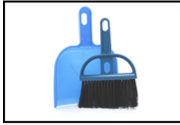
Gambar 3. Produk Sapu Mini

Gambar di atas merupakan gambar dari produk sapu mini terdahulu atau produk pesaing. Produk sapu mini terdahulu masih sangat konvensional dan mengandalkan tenaga manusia. Di lihat dari segi ukurannya sangat kecil maka dari itu memiliki kapasitas sedikit untuk menampung sampah. Sedangkan, produk inovasi sudah memiliki fitur elektrik, dari segi ukuran juga tidak terlalu kecil dan memiliki penutup untuk menampung sampah. Berikut merupakan gambar dari produk sapu mini elektrik.