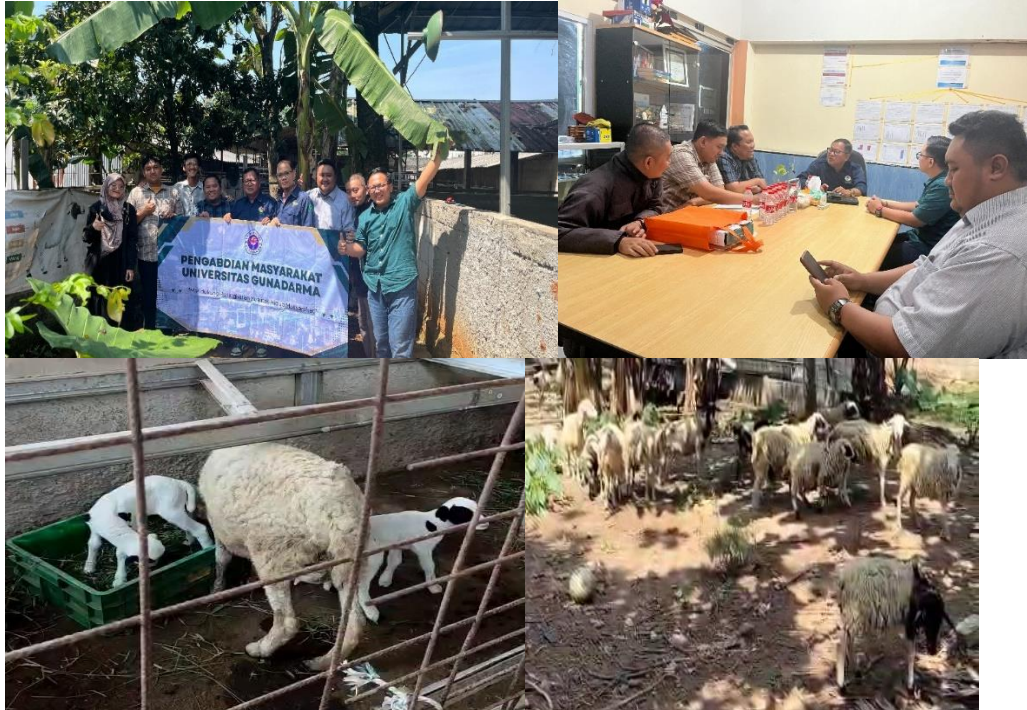
Gambar 3. Foto Kegiatan Pengabdian Masyarakat

Secara umum, program Monitoring Kambing dan Kandang ini memiliki potensi besar untuk direplikasi dan diperluas ke wilayah lain dengan karakteristik serupa.