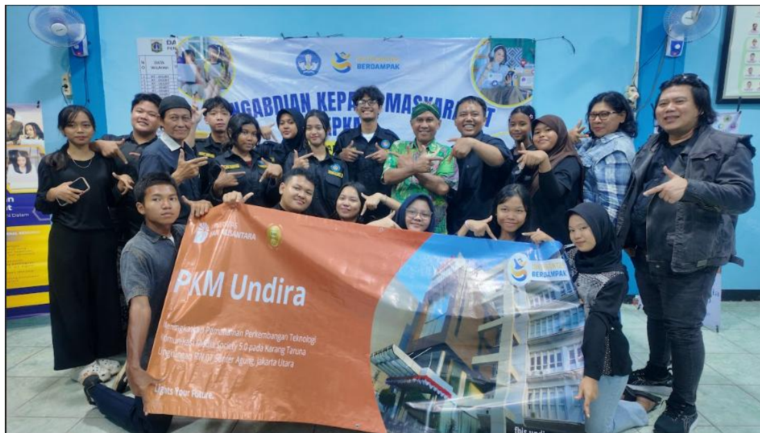
Gambar 3. Foto Bersama Mitra Anggota Karang taruna RW 07 Sunter Agung Jakarta Utara