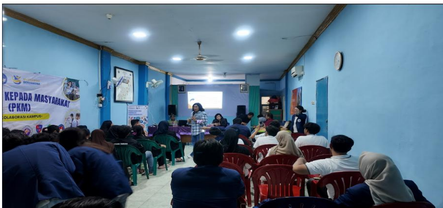
Gambar 2. Aktifitas dalam PKM Kolaborasi 29 November 2025

Pada sesi utama pemaparan materi PkM membahas mengenai seputar Media PR dan Branding, Memperhatikan peran Public Relations dalam membangun konten pada Media Sosial dimana memperluas pengetahuan peserta kegiatan terhadap penggunaan Media sosial sebagai gambaran atau cermin diri dalam isu fenomena Lingkungan hijau pada tempat tinggal mereka. Tips dan Trick dalam memaksimalkan konten media social untuk sebesar-besarnya eksistensi diri dalam hubungan individu didalam aktivitas mereka pada media social secara khusus dan sebagai generasi muda sadar serta berempati pada kebersihan lingkungan hijau.