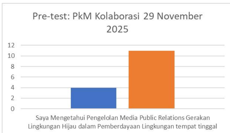
Tabel 2. Hasil Pre-test survey Target PKM Kolaborasi Kelompok Karang Taruna RW 07 Sunter Agung, Jakarta Utara

Dari 15 orang audiens Karang Taruna di RW 07 Sunter Agung, bagian Pernyataan Saya Mengetahui Gerakan Lingkungan Hijau dalam Pemberdayaan Lingkungan tempat tinggal. Didapatkan 5 orang menyatakan tahu mengenai Mengetahui Gerakan Lingkungan Hijau dalam Pemberdayaan Lingkungan tempat tinggal dan 10 orang tidak tahu mengenai Mengetahui Gerakan Lingkungan Hijau dalam Pemberdayaan Lingkungan tempat tinggal.