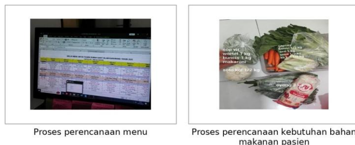
Gambar 1. Dokumentasi perencanaan menu dan kebutuhan bahan makanan pasien

Hasil observasi menunjukkan bahwa pelayanan gizi rawat inap di Rumah Sakit Islam Karawang telah memiliki alur kerja yang mencakup perencanaan menu, perencanaan kebutuhan bahan makanan, pengolahan makanan, dan distribusi makanan sesuai kebutuhan pasien. Proses perencanaan menu dilakukan sebagai dasar penyediaan makanan bagi pasien rawat inap. Dalam konteks pelayanan gizi rumah sakit, perencanaan menu perlu memperhatikan jenis diet, standar porsi, variasi makanan, ketersediaan bahan, dan kemampuan pelayanan agar makanan yang diberikan tetap sesuai dengan kebutuhan klinis pasien (Kementerian Kesehatan Republik Indonesia, 2013; Thibault et al., 2021). Dokumentasi kegiatan menunjukkan adanya proses perencanaan menu dan perencanaan kebutuhan bahan makanan pasien yang menjadi dasar dalam penyelenggaraan makanan rumah sakit.