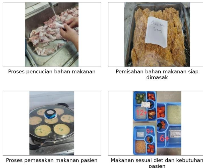
Gambar 2. Dokumentasi proses pengolahan makanan pasien

Pada tahap pengolahan makanan, kegiatan yang teramati meliputi penerimaan dan persiapan bahan, pencucian bahan makanan, pemisahan bahan makanan yang siap dimasak, pemasakan, serta penyiapan makanan sesuai jenis diet pasien. Tahapan ini menunjukkan bahwa pengolahan makanan di instalasi gizi tidak hanya berfokus pada kegiatan memasak, tetapi juga mencakup pengendalian mutu bahan, kebersihan alat, kebersihan tenaga, dan pemisahan bahan untuk mencegah kontaminasi. Prinsip ini sejalan dengan panduan keamanan pangan WHO yang menekankan pentingnya menjaga kebersihan, memisahkan bahan mentah dan matang, memasak secara benar, menjaga suhu aman, serta menggunakan air dan bahan baku yang aman (World Health Organization, 2006).