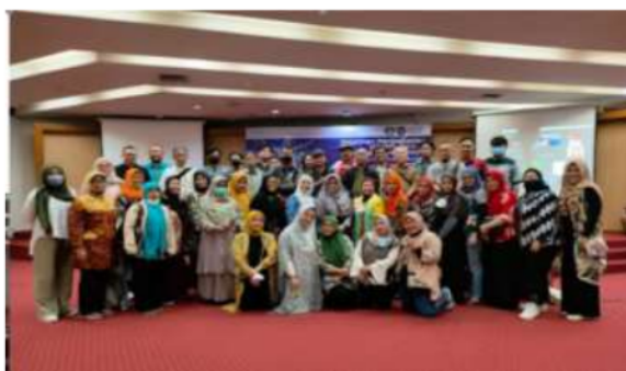
Gambar 2. Kegiatan pelatihan peserta UMKM dan tim

Konteks teknologi dan organisasi mempengaruhi media sosial bagi UMKM di lingkungan Jakarta [10]. Untuk mendukung kemampuan digitalisasi UMKM tersebut, kami dari tim kegiatan pelatihan peningkatan digital skill pengusaha UMKM Batch 1 STIE Muhammadiyah Jakarta bekerjasama dengan Telkom Community Development Center.