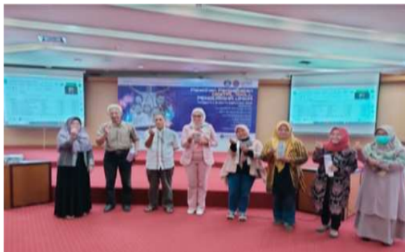
Gambar 3. Kegiatan pelatihan