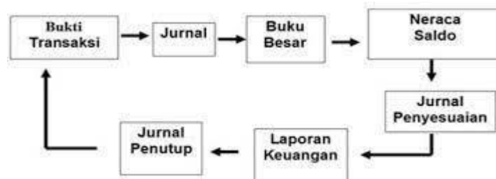
Gambar : Siklus Akuntansi

Sistem yang dapat mencatat, mengatur cara pengelolaan keuangan dari segala aspek yang dapat diterapkan dalam melakukan usaha bisnis untuk semua keperluan, baik untuk usaha kecil maupun dalam perusahaan merupakan salah satu peran aplikasi keuangan MYOB.