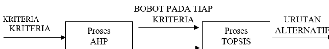
Gambar 1. Integrasi Metode AHP dan TOPSIS

Bobot kriteria yang diperoleh kemudian digunakan sebagai input dalam metode TOPSIS, bersama dengan data alternatif supplier kursi yang tersedia. Dalam proses TOPSIS, dilakukan perhitungan jarak terhadap solusi ideal positif dan solusi ideal negatif untuk setiap alternatif. Hasil akhir dari metode ini adalah berupa urutan atau peringkat supplier kursi, sehingga dapat membantu perusahaan dalam menentukan supplier terbaik sesuai dengan kriteria yang telah ditetapkan.