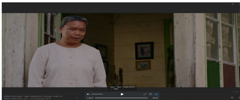
Gambar 4: Mak Domu meminta Pak Domu untuk masuk.