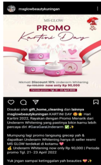
Gambar 5. Konten informasi Diskon