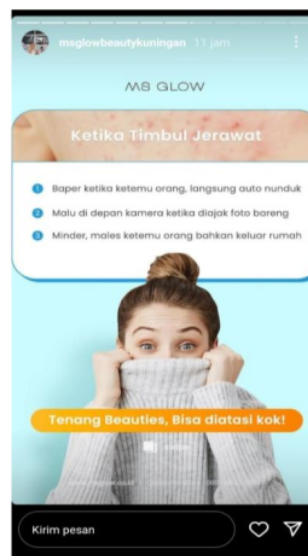
Gambar 6. Konten Penyemangat

Kegiatan kelima, konten diskon. Hal ini menyesuaikan dengan acara-acara besar atau kejadian sesuai pada tanggal tertentu. Seperti konten diatas informasi diskon pada “Kartini Day” yang mana hari spesial dengan mengadakan diskon produk seperti potongan harga pada pembelian “Underarm” hanya dengan 90.000 dan pada postingan tersebut berisikan informasi mulai dari tanggal promo 21-23 April 2022. Dengan memberikan “underarm whitening yang pastinya bikin kamu lebih percaya diri” hal ini menarik konsumen/pengguna untuk membeli