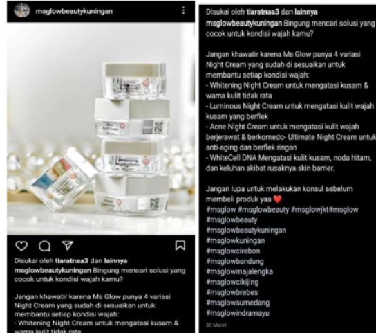
Gambar 3. Konten Jenis-Jenis Cream Malam MS Glow

Konten kedua, tentang informasi jenis-jenis cream malam MS Glow. Informasi mengenai jenis cream MS Glow merupakan salah satu unsur penting pada konsumen. Informasi jenis-jenis cream dalam bidang skincare yang perlu diketahui oleh masyarakat khususnya kepada pengguna skincare MS Glow. Pada konten yang dibuat MS Glow terkait informasi cream malam yang terdapat 4 jenis cream yaitu cream malam whitening , cream malam luminous , cream malam ultimate , dan yang terakhir cream malam acne . Dalam konten ini pemanfaatan media sosial akun Instagram @msglowbeautykuningan memberikan caption dengan berisikan mengenai manfaat pada setiap cream malam MS Glow. Agar konsumen dapat membaca terlebih dahulu informasi yang telah diberikan oleh admin MS Glow pada akun media sosial, dan untuk membantu konsumen memudahkan dalam memilih cream malam sesuai dengan kondisi kulit wajah masing-masing. Dengan hal ini iklan informatif dapat membantu konsumen loyal terhadap produk yang dibeli.