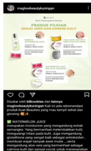
Gambar 4. Konten informasi Rekomendasi Produk

Konten ketiga, tentang informasi konten testimoni pengguna MS Glow salah satu produk MS Glow yaitu serum. Selain aktif menyebarkan informasi mengenai produk MS Glow dan kegiatan lainnya. Hal ini untuk membangun citra yang baik di masyarakat. Instagram @msglowbeautykuningan juga membagikan berbagai testimoni produk mulai dari serum, sunscreen maupun pada paket MS Glow itu sendiri. Hal ini dapat memberikan kepercayaan kepada pengguna/konsumen bahwa produk yang digunakan itu dapat berfungsi dengan baik yang dipakai oleh konsumen. Dengan adanya informasi ini dapat menambahkan kepercayaan kepada konsumen baru dalam membeli produk MS Glow. Selain itu MS Glow Beauty Kuningan memberikan caption pada postingan tersebut mulai dari kandungan pada produk serum, manfaat dari kandungan agar konsumen mendapatkan pengetahuan baru. Dengan memposting konten ini pengikut baru dapat mengetahui berbagai informasi produk, manfaat, kandungan, testimoni, cara penggunaan.