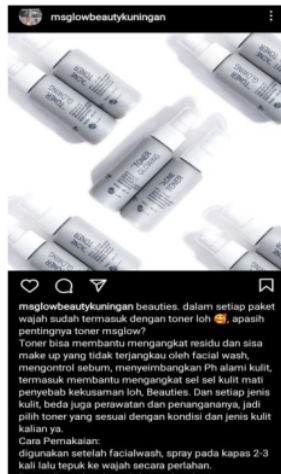
Gambar 2. Konten Pentingnya Toner MS Glow

Berdasarkan hasil penelitian, bahwa kegiatan iklan informatif melalui media sosial Instagram. MS Glow Beauty Kuningan membagikan konten bertujuan dengan memperkenalkan produk yang di jual dan memberikan informasi tentang produk kecantikan. Kegiatan yang dilakukan MS Glow Beauty Kuningan konten yang dikemas dengan menarik dalam bentuk video dan foto yang disebarakan melalui feeds Instagram dan instastory Instagram @msglowbeautykuningan. Tentunya konten-konten yang dibagikan untuk pengguna. MS Glow Beauty Kuningan sejak kurang lebih tahun 2017, MS Glow telah memanfaatkan akun media sosial Instagram sebagai salah satu media sebagai iklan informatif. Iklan disini merupakan yang mengandung informatif mengedukasi mengenai produk skincare. Dengan nama akun @msglowbeautykuningan media sosial instagram yang telah banyak diikuti oleh pengguna instagram sebanyak kurang lebih 4.199 pengikut. Dalam hal ini pengikut yang cukup banyak untuk media sosial yang dipegang oleh MS Glow Beauty Kuningan. Pada jumlah pengikut tersebut dipengaruhi oleh kalangan perempuan dari mulai remaja, dewasa, dan ibu-ibu. Media sosial instagram dirasa membuat media yang sesuai untuk memberikan beragam informasi yang mudah dipahami oleh konsumen. Pemanfaatan media sosial instagram ini dapat memungkinkan untuk menyebarkan informasi terhadap pengguna/konsumen secara meluas dan cepat.