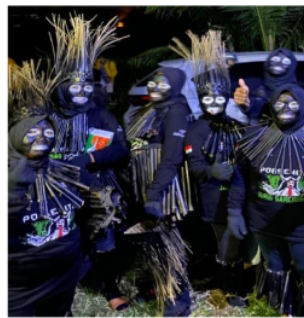
Gambar 1. Kostum Perempuan Jurig Sarengseng

Jurig sarengseng merupakan kesenian asli Indonesia yang berasal dari Desa Binangun Kota Banjar dan diciptakan oleh bapak Tarsono (Alm) pada tahun 2017. Awal mula kesenian jurig sarengseng ada di Desa Binangun berawal dari adanya pelaku seni yaitu bapak Tarsono (Alm). Jurig sarengseng tercatat dalam Warisan Budaya Takbenda Indonesia (WBTD) sebagai seni pertunjukan. Yang dimana pertunjukan dalam kesenian jurig sarengseng berbentuk helaran dan dipertunjukan untuk pawai atau karnaval. Adapun penari dalam jurig sarengseng ditarikan baik oleh laki-laki maupun perempuan. Yang menjadi pembeda dari penari laki-laki dan perempuan, dapat dilihat bahwa penari laki-laki ada yang menggunakan topeng serta mengenakan kostum besar yang didesain menyeramkan seperti hantu, sedangkan penari perempuan menggunakan riasan hitam legam. Akan tetapi untuk kostum baik penari laki-laki ataupun perempuan sama-sama menggunakan kostum dari bambu. Karena sejatinya arti dari kata sarengseng sendiri adalah ujung bambu. Untuk perawatan pada kostum menggunakan cairan clear agar terbebas dari hama. Dan penyimpanan pada kostum berada di Kantor Desa Binangun. Makna dari kesenian jurig sarengseng dapat dimaknai dengan menjaga alam, sebab jurig sarengseng adalah suatu bentuk kesenian ngarumat jagat . Ngarumat jagat sendiri merupakan salah satu tradisi atas ungkapan syukur kepada Allah SWT. dengan upaya dalam menjaga serta melestarikan alam.