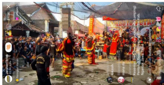
Gambar 3. Live Streaming Akun JarananTiktok

Dapat dikatakan live stream social media saat ini menjadi media yang paling populer yang dimana pengguna dapat menyiarkan video secara langsung kepada khalayak umum tanpa adanya proses editing. Ketika pengguna sedang live streaming terdapat fitur live chat yang dapat berguna bagi para penonton untuk dapat berkomentar. Adapun contohnya seperti twitch, tiktok, v live, dan youtube live. Di Indonesia saat ini baik dari kalangan artis maupun masyarakat gemar melakukan live melalui tiktok, live streaming tersebut bisa ditonton hingga luar negeri dan tidak jarang pada kolom komentar tersebut terdapat orang asing didalamnya. Jurig sarengseng dapat memanfaatkannya dalam melestarikan dan memperkenalkan kesenian. Dengan menampilkan secara live pertunjukan jurig sarengseng melalui tiktok. Tidak sedikit ketika sedang berselancar menggunakan platform tiktok, live streaming berupa konten kesenian sudah ada dan live tersebut mencapai ribuan pengguna yang menonton. Pengguna memberikan likenya dan memberikan hadiah pada live streaming tersebut. Seperti halnya pada saat akun @JarananTiktok melakukan live streaming, pengguna dapat berkomentar dan menikmati pertunjukan. Live tersebut ditonton kurang lebih oleh 1.200 pengguna tiktok dari berbagai penjuru. Tidak sedikit penggunanya memberikan hadiah pada live streaming serta mengajukan pertanyaan.