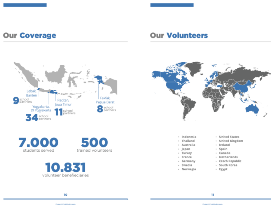
Gambar 2. Ekspansi Project Child Indonesia

dengan 500 relawan terlatih, dan total relawan penerima manfaat mencapai 10.831. Jumlah keseluruhan relawan tergabung dalam Project Child Indonesia tersebar ke seluruh wilayah baik dalam maupun luar negeri seperti pada gambar terlampir.