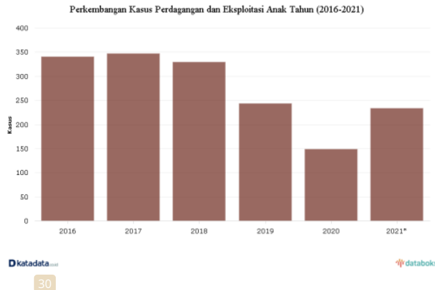
Gambar 1. Angka Perkembangan Kasus Perdagangan dan Eksploitasi Anak Tahun (2016-2021)

kemerosotan ekonomi keluarga. Fakta ini cukup menjadi kekhawatiran tersendiri khususnya bagi pemerintah untuk memberi awasan kepada orang tua maupun orang terdekat dari anak di bawah umur untuk berhati-hati kepada segala motif kejahatan yang bisa datang dari berbagai cara.