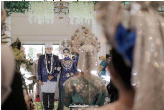
Wedding Photography Karya Bima Prakusa