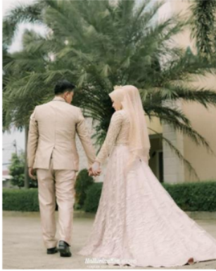
Wedding Photography Karya Febryandito

Berikut merupakan karya wedding photography narasumber/informan :