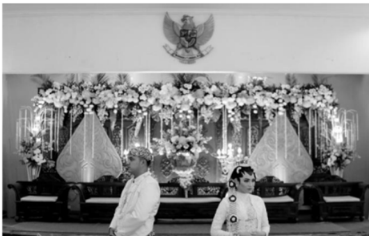
Wedding Photography Karya Akhmad Jumali